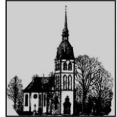
St. Philippus Neri Holsen