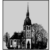
St. Philippus Neri Holsen