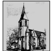
St. Petrus und Paulus Scharmede