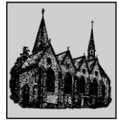
St. Bartholomäus Verne