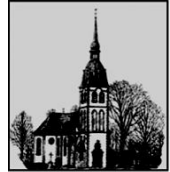
St. Philippus Neri Holsen