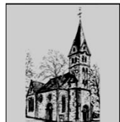
St. Antonius Mantinghausen