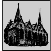
St. Bartholomäus Verne