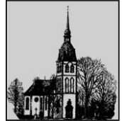
St. Philippus Neri Holsen