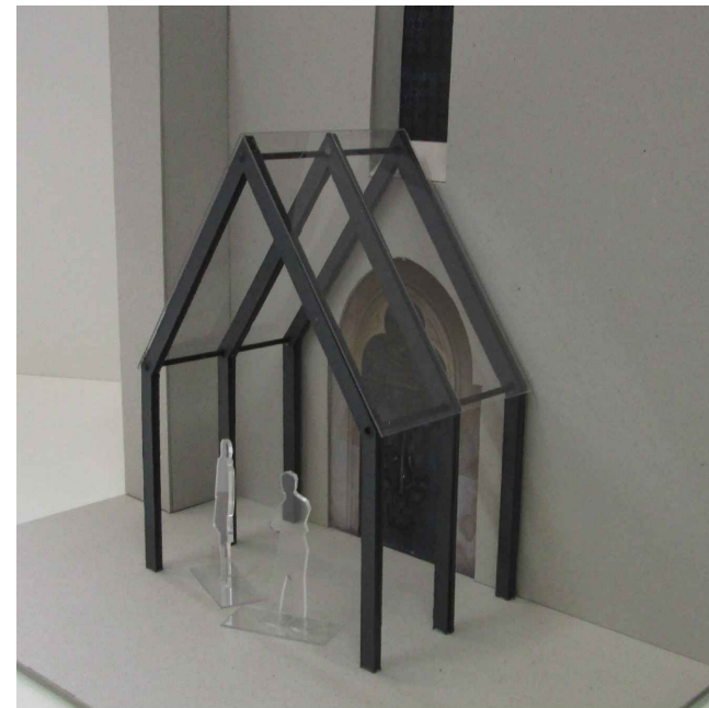
Arbeitsmodell mit 3 Stahlrahmen