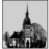
St. Philippus Neri Holsen