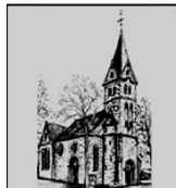
St. Antonius Mantinghausen