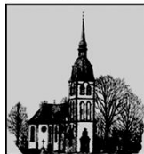
St. Philippus Neri Holsen