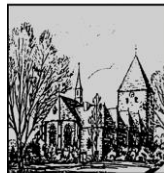
St. Laurentius Thüle