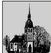
St. Philippus Neri Holsen