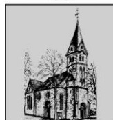
St. Antonius Mantinghausen