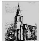
St. Petrus und Paulus Scharmede