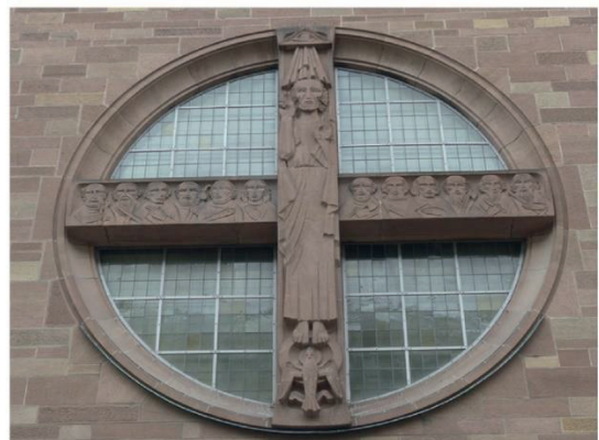
Rosette der Kathedrale St. Eberhard Stuttgart

Die Rosette der Konkathedrale des Bistums Rottenburg-Stuttgart, der Domkirche St. Eberhard, symbolisiert, wofür der Katholikentag in Stuttgart vom 25. bis 29. Mai steht: die Gemeinschaft der Menschen mit Gott und untereinander.