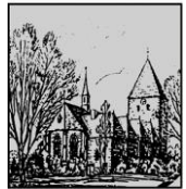
St. Laurentius Thüle