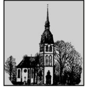
St. Philippus Neri Holsen