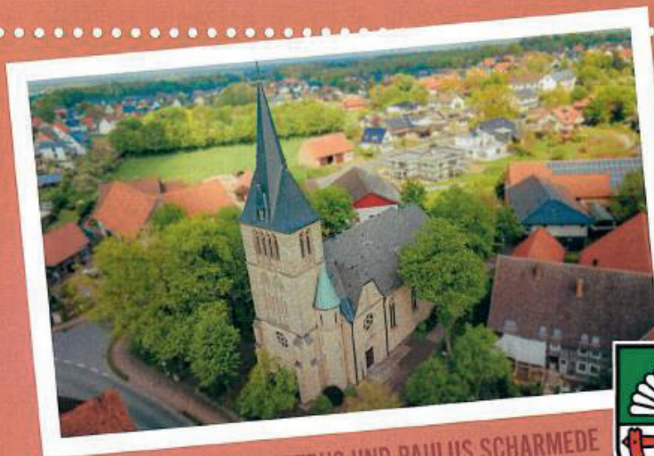
KIRCHENGEMEINDE ST. PETRUS UND PAULUS SCHARMEDE