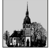
St. Philippus Neri Holsen