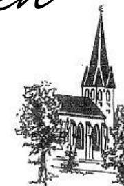
St. Matthäus Niederntudorf

der Katholischen Kirchengemeinden St. Georg Oberntudorf und St. Matthäus Niederntudorf im Pastoralverbund Salzkotten