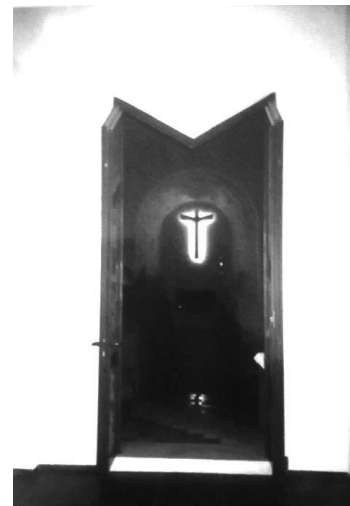
Lichtkreuz von Heinz Mack in der Kapelle des ehem. Collegium Marianum in Neuss

Als ich 1990 meinen Weg zum Priesterberuf in Neuss begann um mein Abitur zu machen, wurde mir ein Ort besonders wichtig. Es ist die Kapelle des Collegium Marianum. In dieser Kapelle ist im Chorraum ein großes weißes Kreuz aus Marmor angebracht. Dahinter ist in der gleichen Form ein Fenster. Das hat den Effekt, dass sich selbst bei großer Dunkelheit ein Lichtkranz um dieses Kreuz legt. Es gibt für mich keine bessere Darstellung von Tod und Auferstehung, als dieses Lichtkreuz. Der Lichtkünstler Heinz Mack hat es 1988 gestaltet. In der gegenwärtigen Zeit denke ich oft an diesen Ort mit dem besonderen Kreuz. Es zeigt mir, dass selbst durch die größte Dunkelheit das Osterlicht durchscheint. Nicht das Dunkle unserer Welt und das Böse haben das letzte Wort, sondern Jesus besiegt das alles ein für allemal durch seinen Tod und seine Auferstehung. Wir sind eingeladen uns dieser Botschaft wieder neu zu stellen, damit wir Hoffnung finden, die uns hilft unser eigenes Leben aus dem Glauben heraus zu leben.