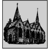
St. Bartholomäus Verne

Seite an Seite sitzt Maria mit ihrem Sohn auf der „Himmelsbank“. Er legt seinen Arm um ihre Schulter und sie fühlt sich willkommen und geborgen. Fast 1.700 Jahre alt ist dieses Mosaik in Santa Maria in Trastevere (Rom). Ohne jede Himmelfahrtsdramatik erzählt es den Kern des Festgeheimnisses: Wie Maria fallen auch wir am Ende unseres Lebens nicht in dunkle Einsamkeit, sondern Christus umarmt uns, wenn wir kommen.