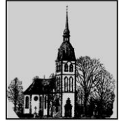
St. Philippus Neri Holsen