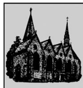
St. Bartholomäus Verne