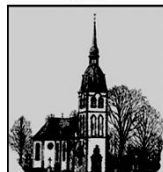
St. Philippus Neri Holsen