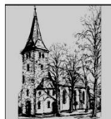
St. Franziskus Xaverius Verlar