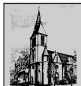
St. Petrus und Paulus Scharmede