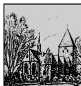
St. Laurentius Thüle