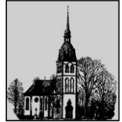
St. Philippus Neri Holsen