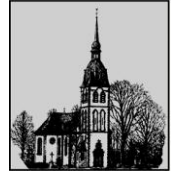
St. Philippus Neri Holsen